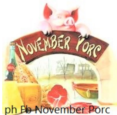
ph Fb November Porc

La Bassa Parmense è un territorio della pianura padana posto a nord di Parma , che va dal fiume Po alla via Emilia , delimitato a levante dal fiume Enza ed a ponente dal torrente Ongina , nella regione Emilia-Romagna , in cui gli aspetti enogastronomici rappresentati da prodotti tipici d'eccellenza,