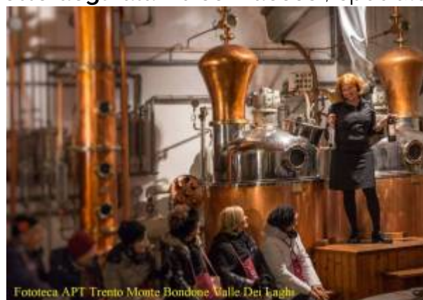
Fototeca APT Trento Monte Bondone Valle Dei Laghi

La manifestazione si avvale anche del prezioso coordinamento della Strada del Vino e dei Sapori del Trentino nell'ambito della promozione delle manifestazioni enologiche provinciali denominate #trentinowinefest . Oltre che della collaborazione di APT Trento, Monte Bondone, Valle dei Laghi ed Istituto