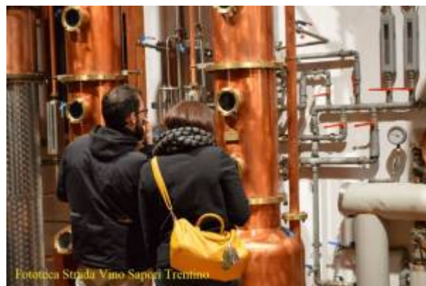
Fototeca Strada Vano Sapori Trentino

Questo incantevole borgo, che dista una manciata di chilometri da Trento , è raggiungibile percorrendo la strada che collega la suggestiva Valle dei Laghi al Lago di Garda . Tra le antiche costruzioni ed i viottoli che lo contraddistinguono, da generazioni, a pochi passi una dall'altra, sono attive cinque distillerie di grappa a