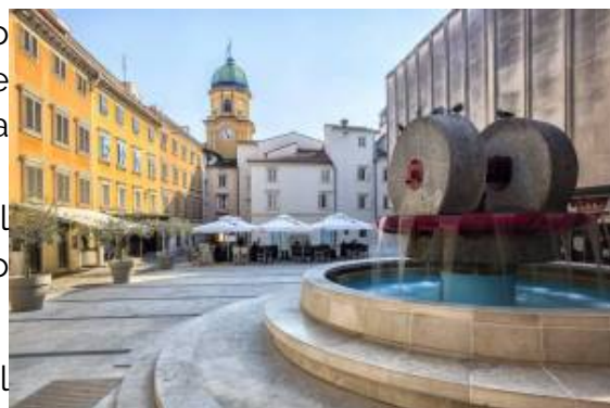
Rijeka (2)

stata designata quale capitale europea della cultura per il 2020. La città ospita anche il Caffè Jazz Tunel, un bar con musica live scolpito nella pietra ed il primo hotel galleggiante della Croazia, il Marina Botel, un