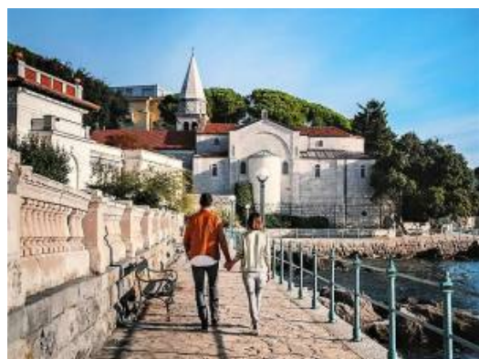
Opatija lungomare

vecchio traghetto adesso ormeggiato al molo cittadino, con camere davvero originali ed una vista da incanto.