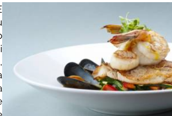
Gastronomia Quarnaro

In Europa, sono pochi i luoghi in cui è possibile avvistare gli orsi. Ai piedi delle maestose montagne del Gorski Kotar, all'interno del Parco Nazionale Risnjak, da inizio giugno i