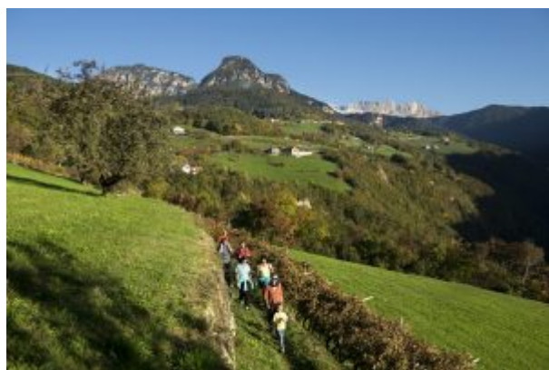
Alpe di Siusi

L'enrosadira la conoscono tutti; un fenomeno che si verifica al tramonto quando i "Monti Pallidi", le Dolomiti, si accendono di sfumature rosate, viola e cremisi. Uno spettacolo accentuato dalle tinte calde dell'autunno, il periodo in cui viene organizzato "Burning Dolomites", nel cuore della Val Gardena. Fino al 3 novembre, è previsto un doppio appuntamento settimanale, il mercoledì si raggiunge in tre ore il terrazzo panoramico Sëurasass al calar del sole, per ammirare la vista sul Gruppo Sella, Sassolungo e l'Alpe di Siusi (partenza alle 15.00), il venerdì si cammina dallo Stevia all'Alpe Juac, un'escursione più difficile, della durata di 5 ore (partenza alle 13.00), con una guida. L'altitudine non eccessiva rende queste mete alla portata degli escursionisti anche in autunno inoltrato.