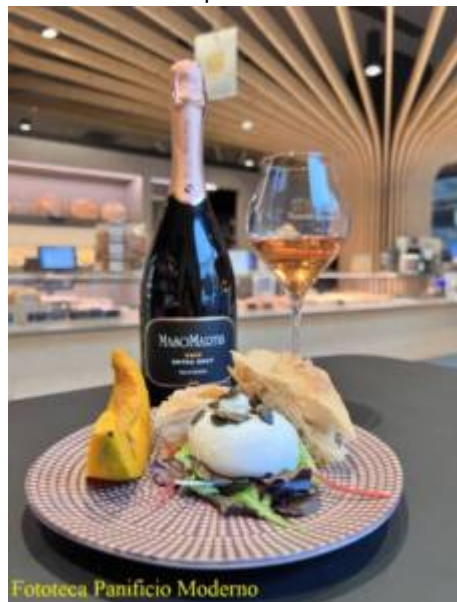
Fototeca Panificio Moderno

Taste&Walk in città dal bosco al vigneto , una passeggiata sulla collina di Rovereto tra boschi e vigneti, con conclusione in centro storico, brindisi Trentodoc e pranzo, dal lunedì al sabato fino al 17 dicembre.