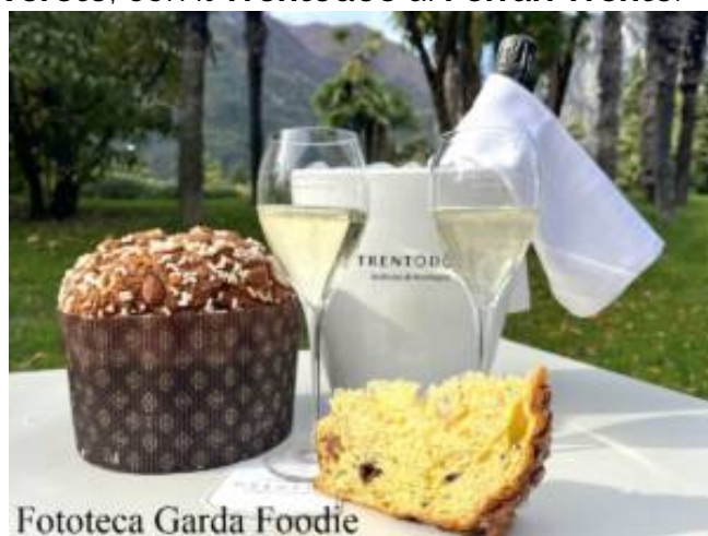
Fototeca Garda Foodie

In Vallagarina , si può partecipare a 3 chiavi di lettura del perlage presso Locanda delle Tre Chiavi di Isera , con il Trentodoc di Cantina d'Isera , Cantina Sociale Trento ed Azienda Agricola