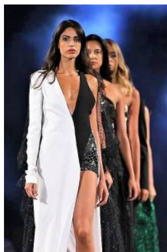
ph fashion show 2018 Genny

Taormina, splendida città collinare distesa sulla costa orientale della Sicilia, conosciuta ed apprezzata per il suo paesaggio naturale, le bellezze marine ed i suoi monumenti storici e situata nei pressi del Monte Etna, nel corso dell'estate 2019